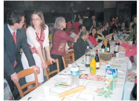
Agapes pascales après la liturgie