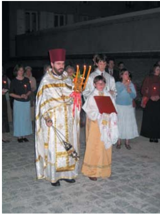
Matines pascales le 30 avril