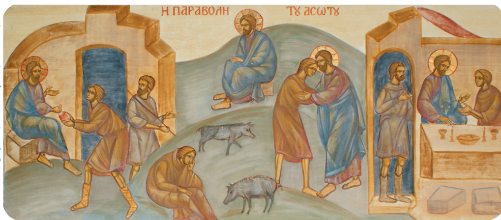
Fresque du Fils prodigue - réfectoire