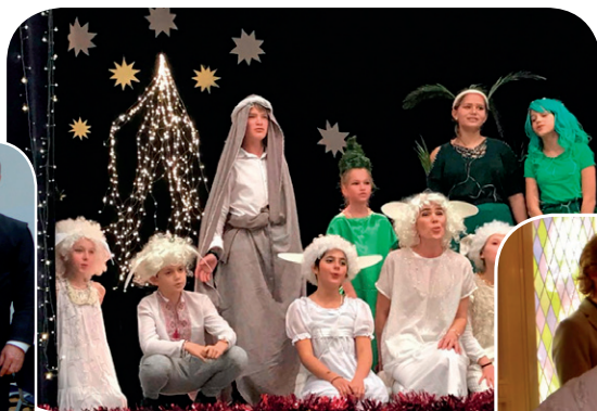
Fête de Noël