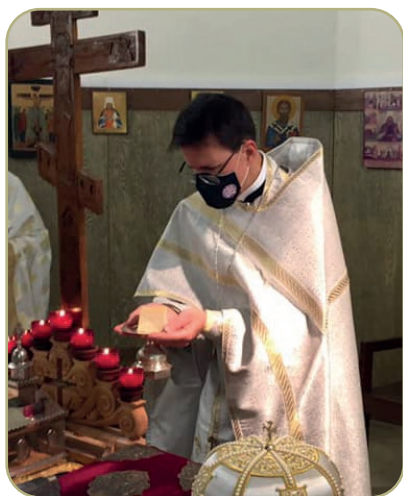
père Kyrille