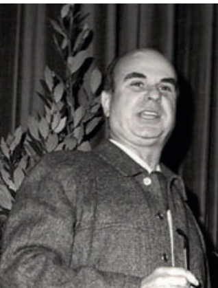
Olivier Clément, 1983