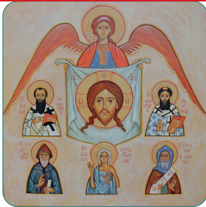
Les saints des dimanches du Grand Carême entourant le Christ, © PAROISSE SAINT BASILE NANTES

les structures sociales et même, malheureusement aujourd'hui, les structures ecclésiales.