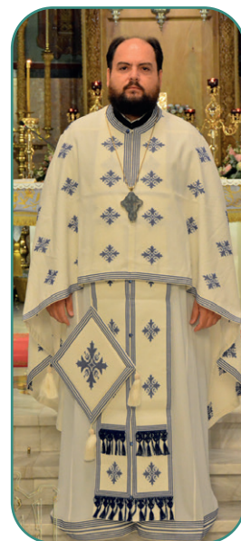
père Ambroise (Stampliakas)